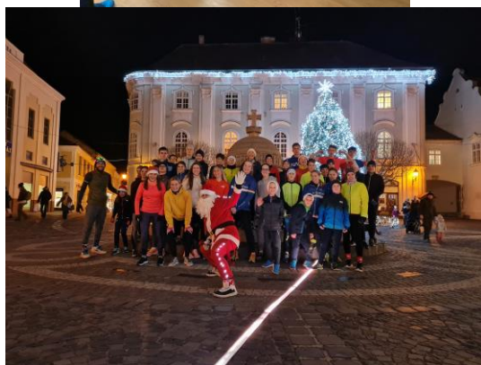
Csapatépítő „szökés az Alcatracból”