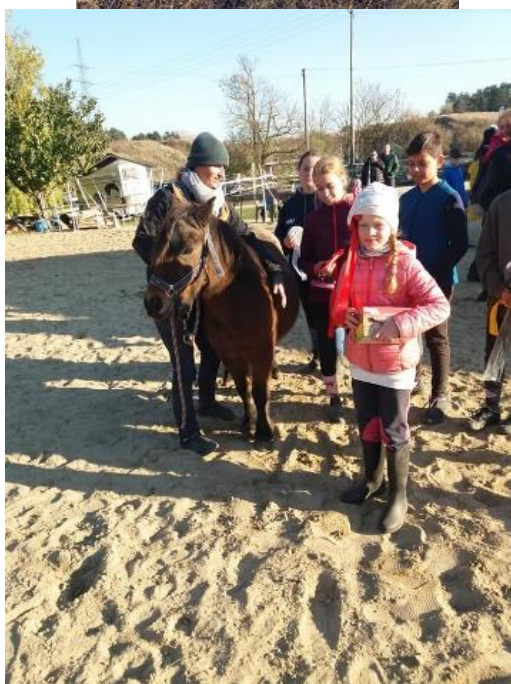
8. A tömeg, - szabadidős, -és rekreációs sport eredményei.