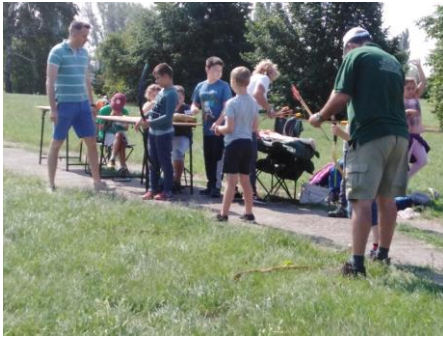
2021. július 20,27, aug.03,10.: HONVÉDELMI Gyerektábor-íjásztatás