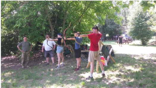
2021. október 01 JÁRŐR-verseny (PÁKOZD)