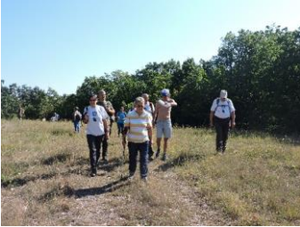
Mikulás túra képei: