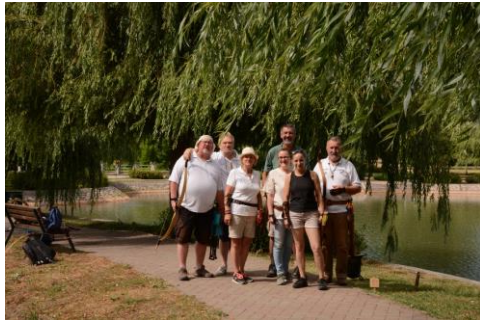
2021. július 03.: Íjászat Peytu erdejében...vagy tópartján (PÉTFÜRDŐ)

Az atlétikai szakosztály működése a Szondi Sportegyesületben mindössze négy hónapra tekint vissza. Bár az egyesülettel a kapcsolat felvétele már júliusban megtörtént, a konkrét események szeptemberben vették kezdetüket. A szakosztály az utánpótlás nevelést, az alulról történő építkezést tűzte ki célul.