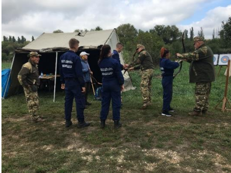
2021. szeptember 18-19 FALU napi – ijáasztatás (ZALASZÁNTÓ)