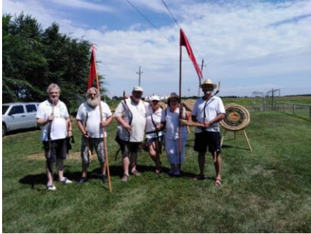
HONVÉDELMI Nap ált. iskolásoknak (KIRÁLYSZÁLLÁS – Nagy-Magyarország Park)