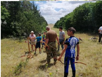
2021. július 02. (CSŐR – dombtető) Honvédelmi nap középiskolásoknak Tájfutóverseny