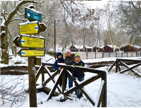
útvonlán: Kép a Rockenbauer Pál Dél-dunántúli Kéktúra