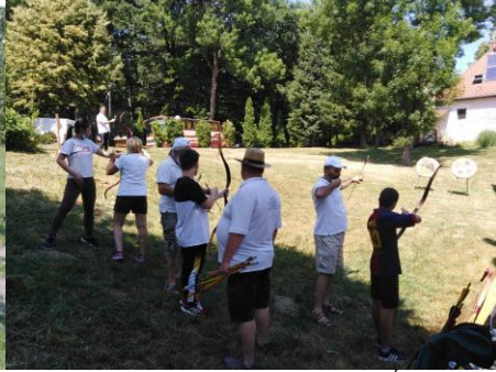
2021. július 07.: HONVÉDELMI Nap (KIRALYSZÁLLÁS – Nagy-Magyarország