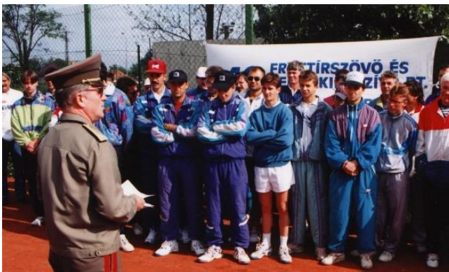
Szondi- Kupa megnyitó