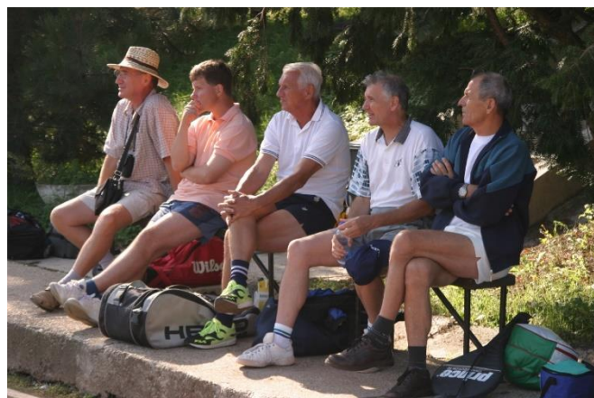
A megdöbönt ellenfél