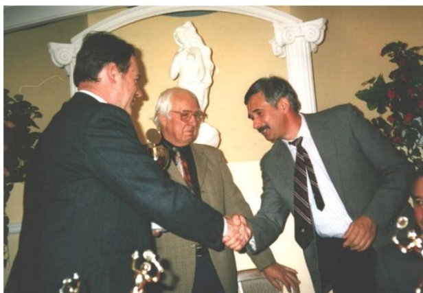
a „Teniszért” kitüntetés átvétele