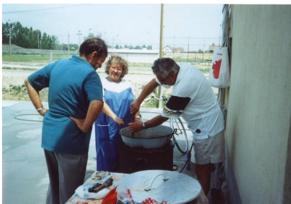
Szentes itt is keveri...

A szakosztály alapító tagjai, legfontosabb támogatóink vehették át a szakosztály vezetőjétől az ünnepségre készített emlékplaketteket és a szakosztály 25 évét bemutató CD lemezt.