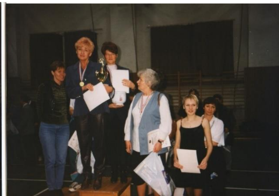
Arattunk a Zrínyi Kupán