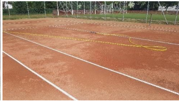
Karbantartás utáni állapot

A 3-as pályán a játékot elkezdni nem tudtuk, mert a pálya elkészülte utáni napon a vírus járvány miatt a Sportcentrum bezárásra került, ezért a pályákon a játék abbamaradt.