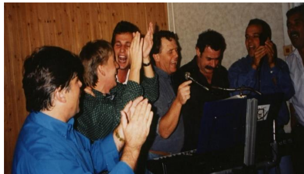
a győzelmi ünnep