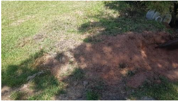
Pályák kiinduló állapota